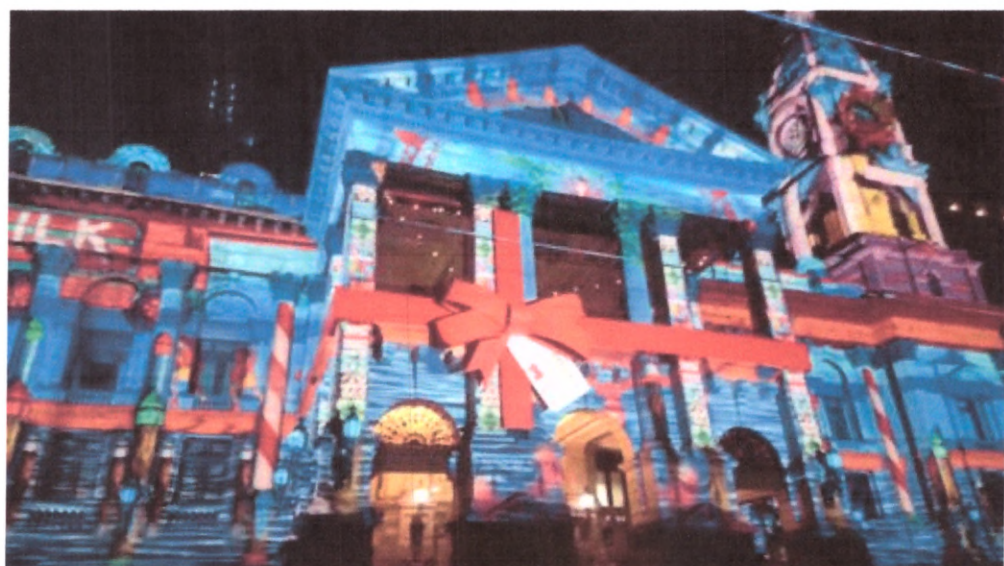
Малюнок дизайну 2