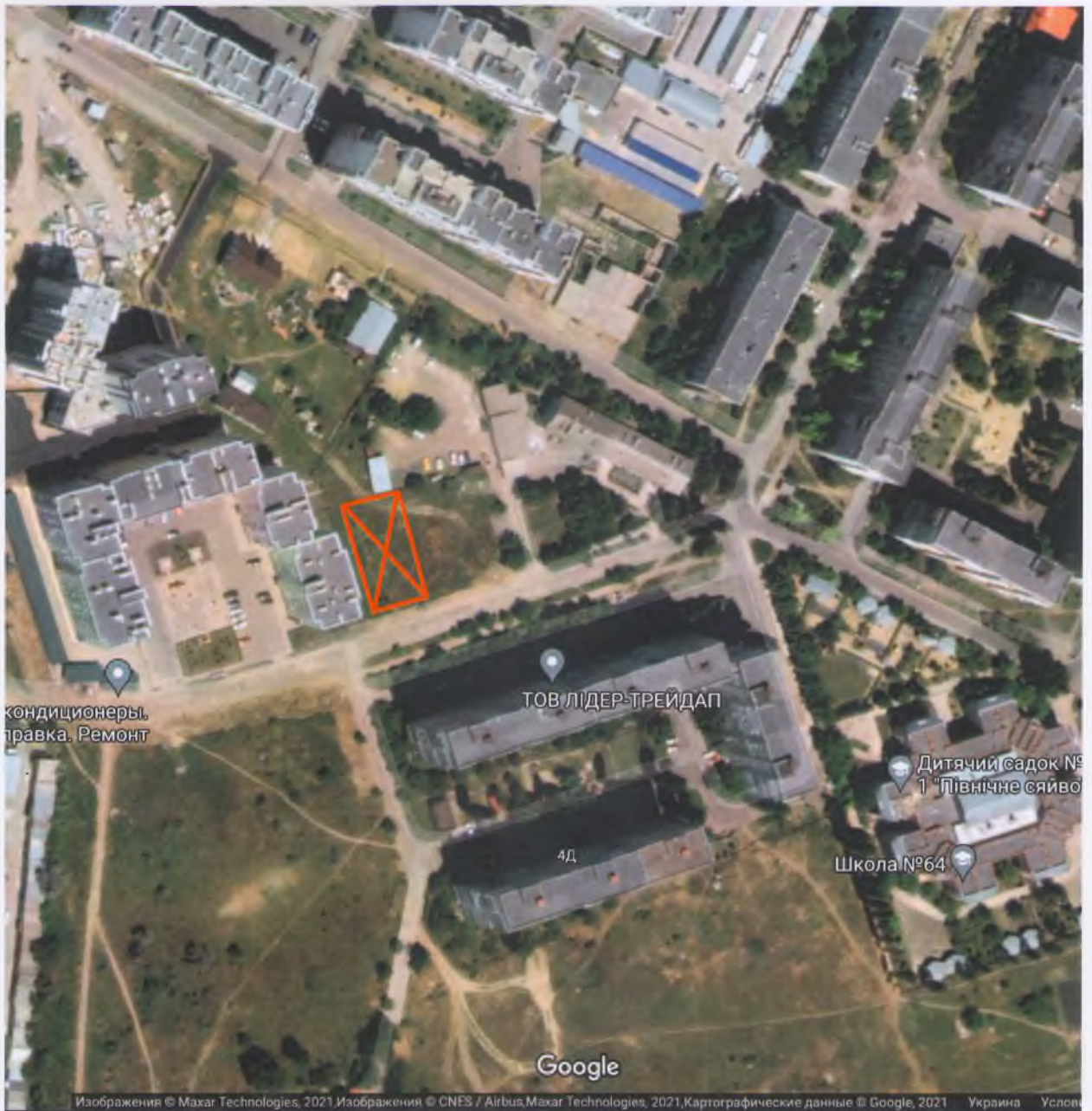
Додаток 1 – Топографічний план схема прилеглої території із зазначеннями земельної ділянки, де запланована реалізація проекту