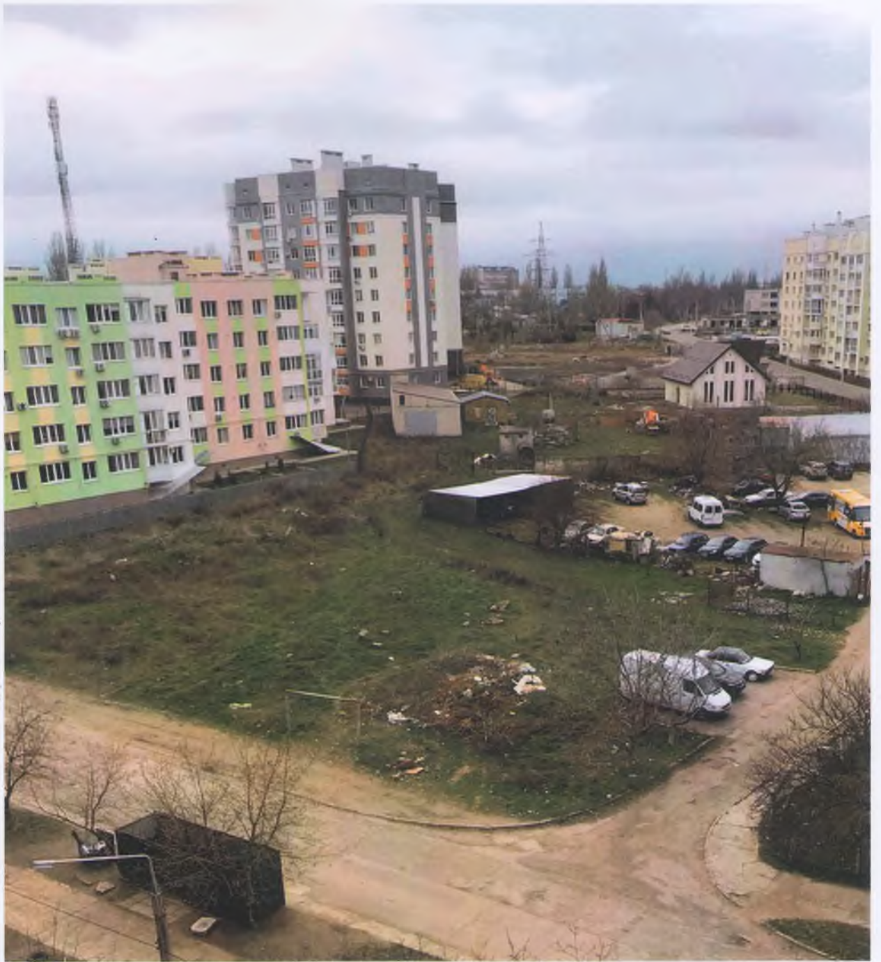
Додаток 4 - Вигляд земельної ділянки зараз