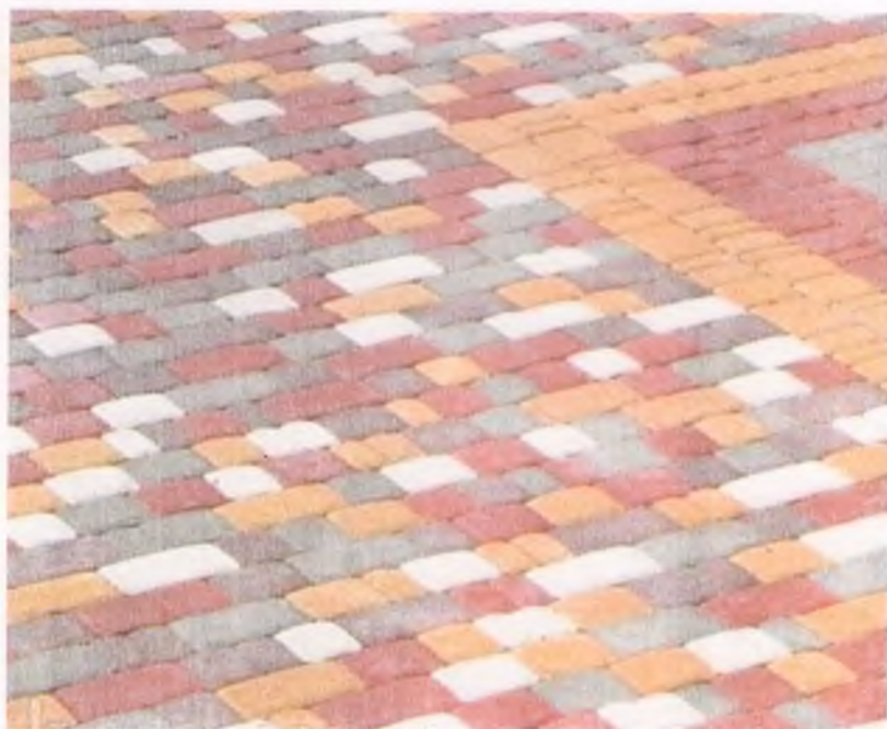
Трогуарна плитка «Старе місто», Різнокольорова, як на малюнку.