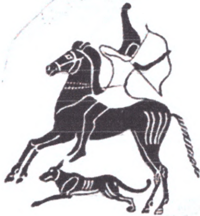
Кімерійській вершник (зображення)