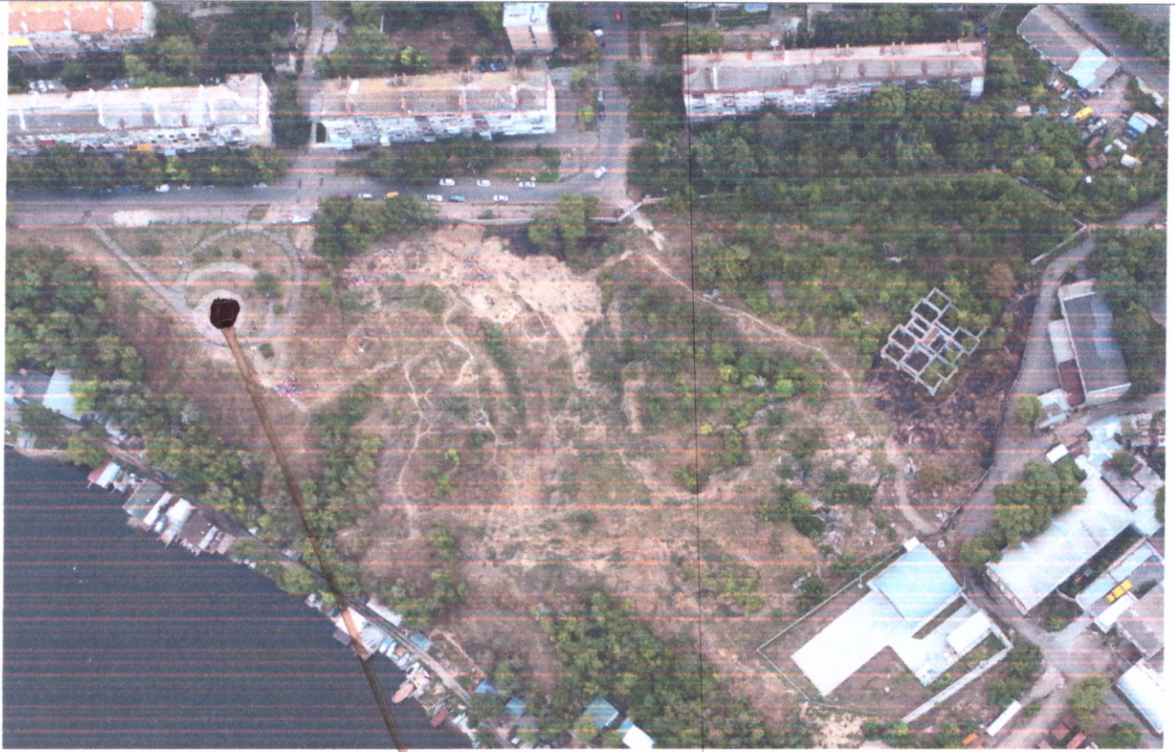
– Місце розташування