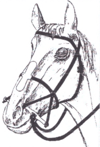
Реконструкція положення кістяних пластин в вузді