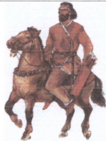
Кімерійській вершник (приблизна реконструкція)