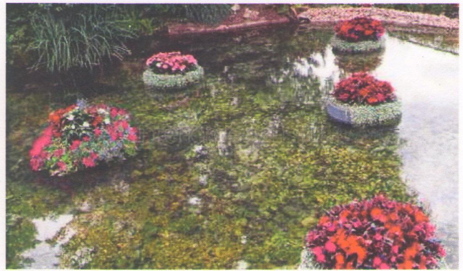
Облаштування каскадного водоспаду та озера з клумбами для сезонних квітів.