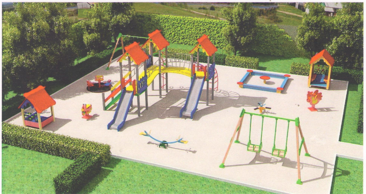
Дитячий ігровий майданчик