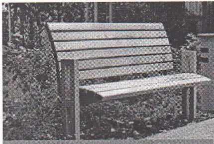
Лавка з високою спинкою