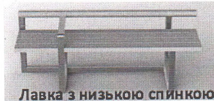
Лавка з низькою спинкою