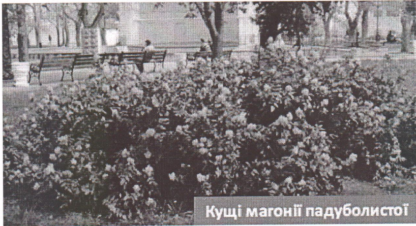
Кущі магонії падуболистої