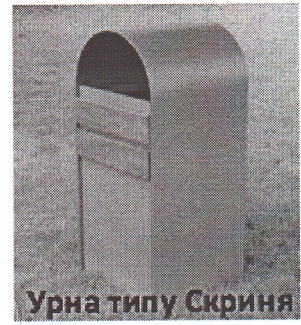
Урна типу Скриня