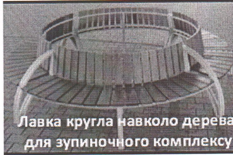
Лавка кругла навколо дерева для зупиночного комплексу